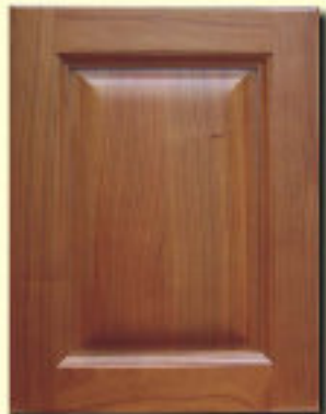
Typ 5 F-0 czereśnia kol. S 69