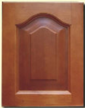
Typ 1 F-S olcha kol. R 107