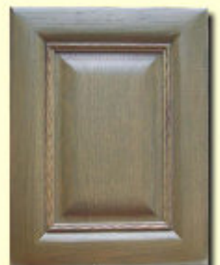
Typ 9 F-0 dąb kol. A01