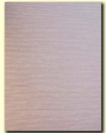
Typ 11 dąb bielony