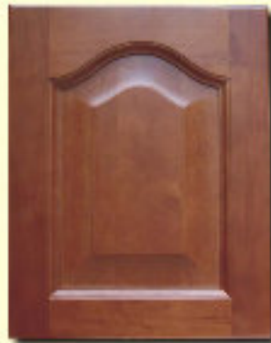
Typ 1 F-L olcha kol. R 109