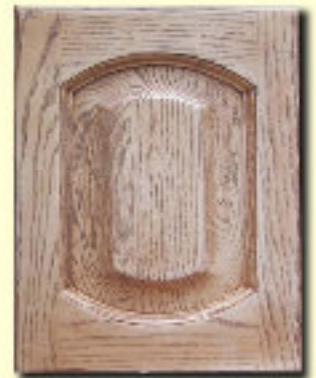
Typ 3 F-L dąb kol/ ICA 100+P