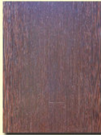
Typ 11 dąb wenge