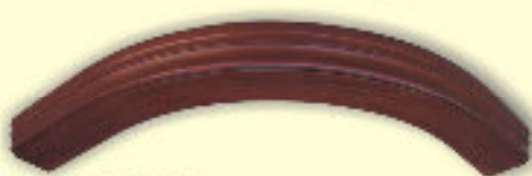
Łuk LIF ATG 101B +patyna oscoro