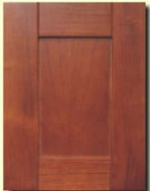
Typ 6 F-P17,5 czereśnia kol. D 1972