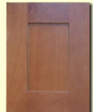
Typ 7 F-P17,5 buk kol. R 62