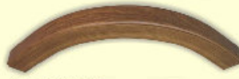
Łuk LIP SOP 22-25 brunat