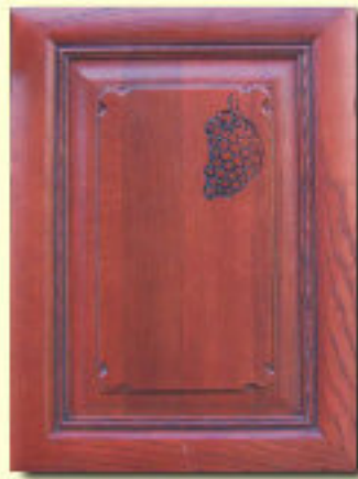
Typ 10 F-SK dąb kol. 210P