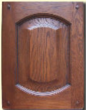
Typ 4 F-L dąb kol. R 74+P