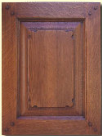
Typ 12 F-SKK dąb kol. FIP 106+P-OSC