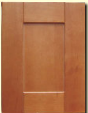
Typ 6 F-P17,5 buk kol. R 63P