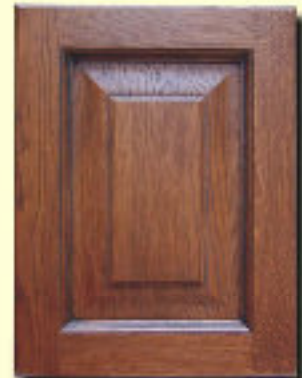
Typ 5 F-S dąb kol. S 79+P