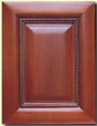
Typ 9 F-0 czereśnia kol. S120P