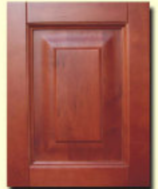
Typ 5 F-S olcha kol. ATG 003