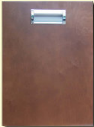
Typ 13 U-PI olcha kol. 12-9