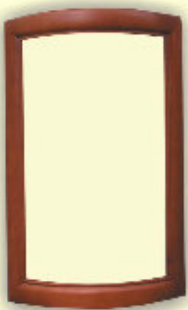
Fronty gięte witryny