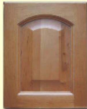
Typ 2 F-L olcha kol. R 262