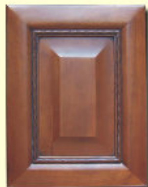
Typ 9 F-L olcha kol. R 105P