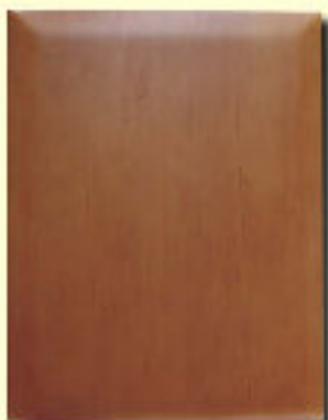
Typ 8 mydelko olcha kol. R 262-5%P