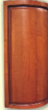
Fronty gięte pełne