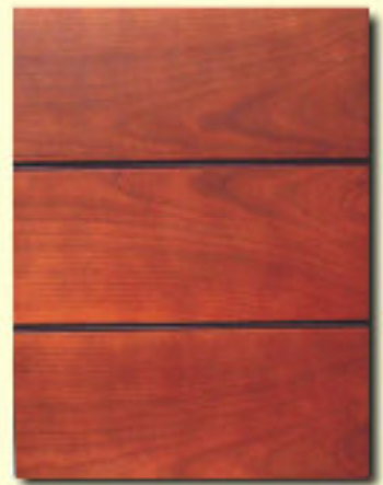
Typ 14 czereśnia kol. FP 101 B