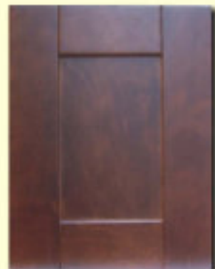
Typ 6 F-P17,5 olcha kol. SOP 22-68