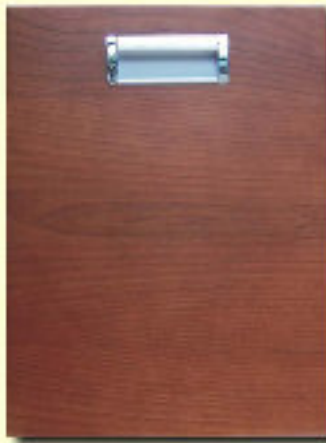
Typ 13 U-PO czereśnia kol. ATG 101 B